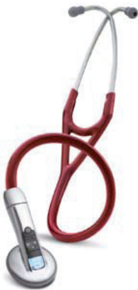
3M™ Littmann® Elektronische Stethoscoop Model 3100