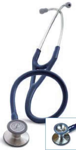
3M™ Littmann® Cardiology III Stethoscoop