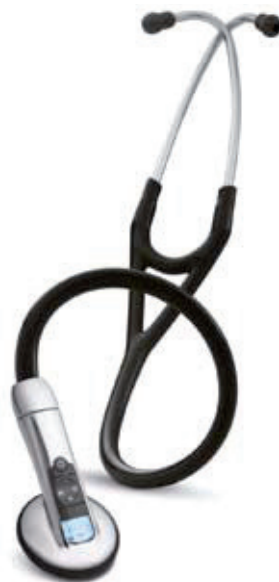
3M™ Littmann® Elektronische Stethoscoop Model 3200

Model 3200 bezit alle eigenschappen van Model 3100.