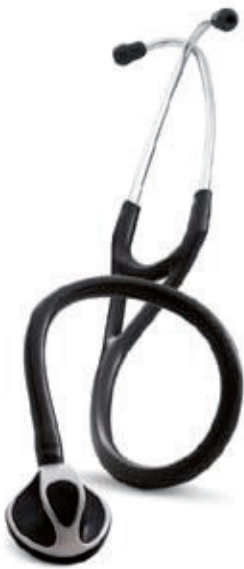
3M™ Littmann® Cardiology S.T.C. Stethoscoop