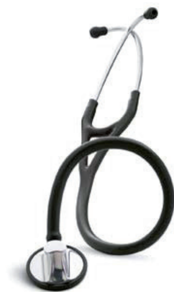
3M™ Littmann® Master Cardiology™ Stethoscoop