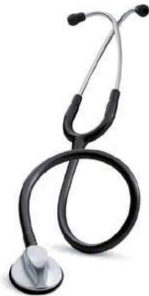
3M™ Littmann® Master Classic II Stethoscoop